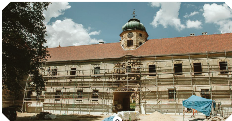
w trakcie renowacji